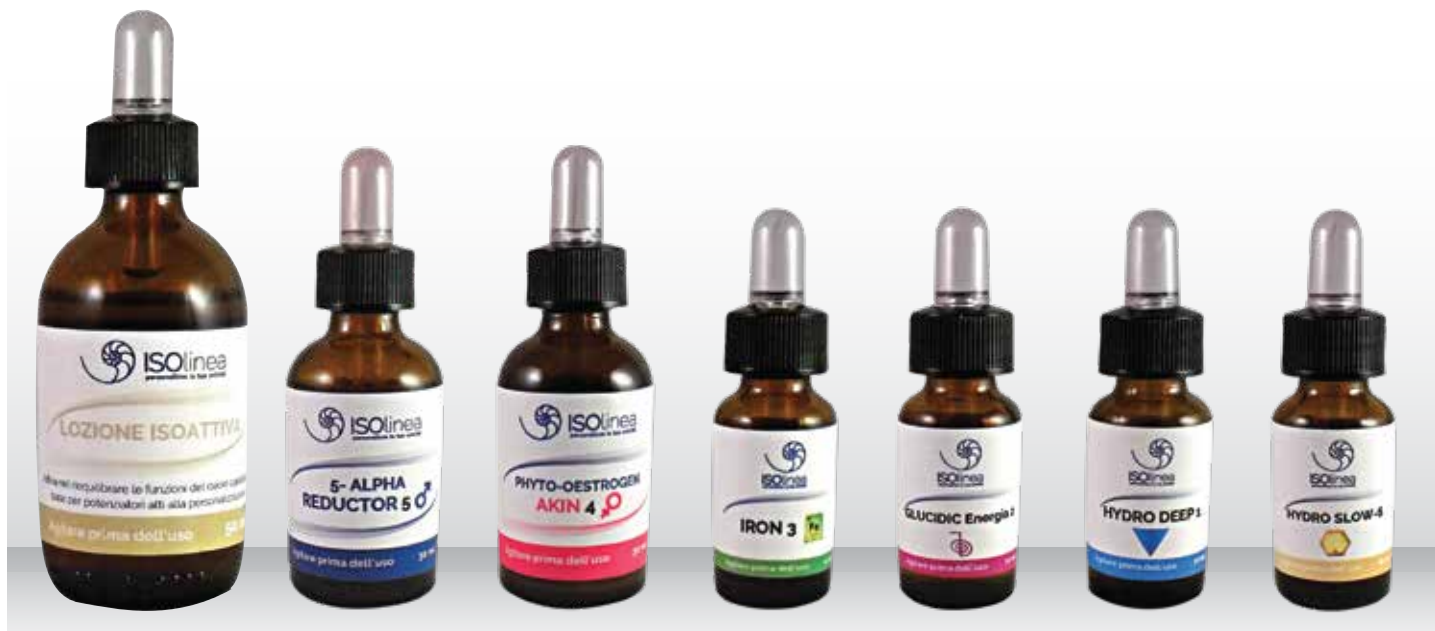
Fig. 1 Lozione ISOattiva con i sei potenziatori.

L'essere umano nasce con un patrimonio di follicoli dai quali escono i capelli, una cornice importantissima del nostro volto, della nostra persona. Ci rapportiamo al mondo esterno con un'immagine fatta di varie componenti, ma i capelli rivestono un ruolo fondamentale, infatti una testa "a posto", esteticamente gradevole, fornisce sicurezza e autostima. Il benessere psicofisico di un soggetto passa dalla sua accettazione e da come viene accettato dal mondo che lo circonda. La degradazione estetica dei capelli passa per primo da forme di "impoverimento", quindi capelli che diventano opachi, si assottigliano, non sono più belli come prima e hanno meno massa. Il peggior caso è quando si assiste ad un impoverimento di quantità. In ISOLINEA siamo cosapevoli che il diradamento dei capelli è frutto di una alterazione del naturale equilibrio che i capelli avevano precedentemente.